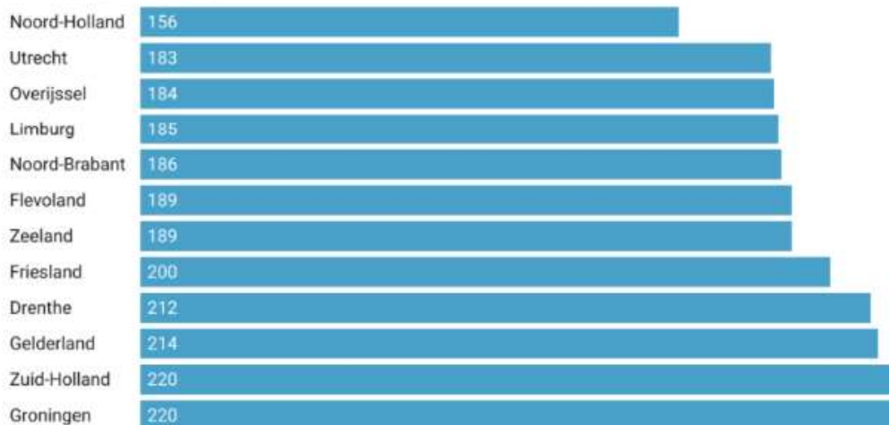
Figuur 2: opcenten per provincie