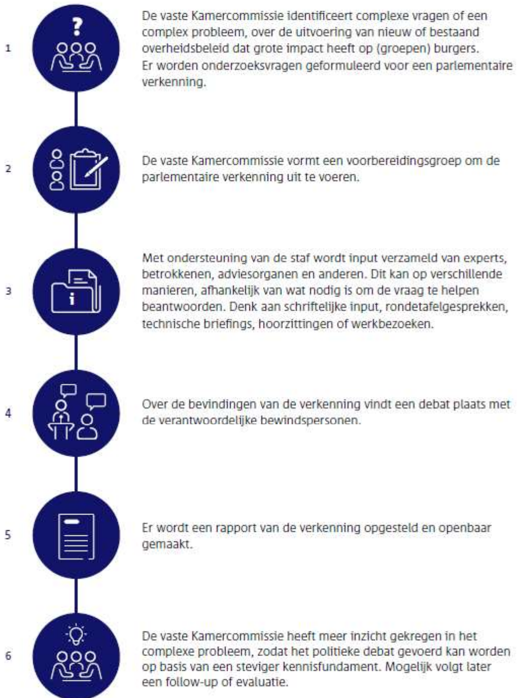
Figuur 4: mogelijke opzet parlementaire verkenning. In voorliggende verkenning heeft stap 4 'debat met verantwoordelijk bewindspersoon' niet plaatsgevonden omdat het onderwerp Betalen naar Gebruik controversieel is verklaard door de Kamer.