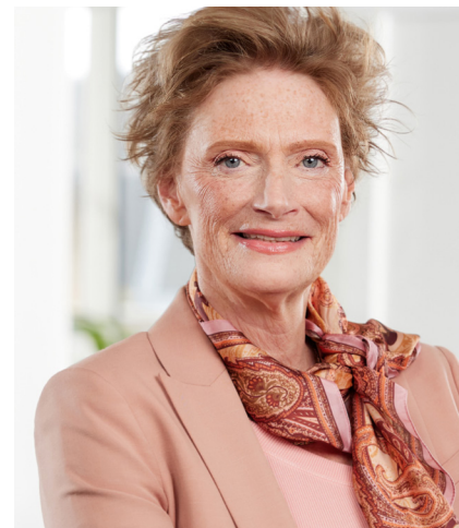
Alida Oppers Inspecteur-generaal van het Onderwijs

Kortom, goede schoolexamens, zorgvuldig georganiseerd en op tijd afgerond. Als eindexamenleerling zou je dat toch ten minste mogen verwachten?