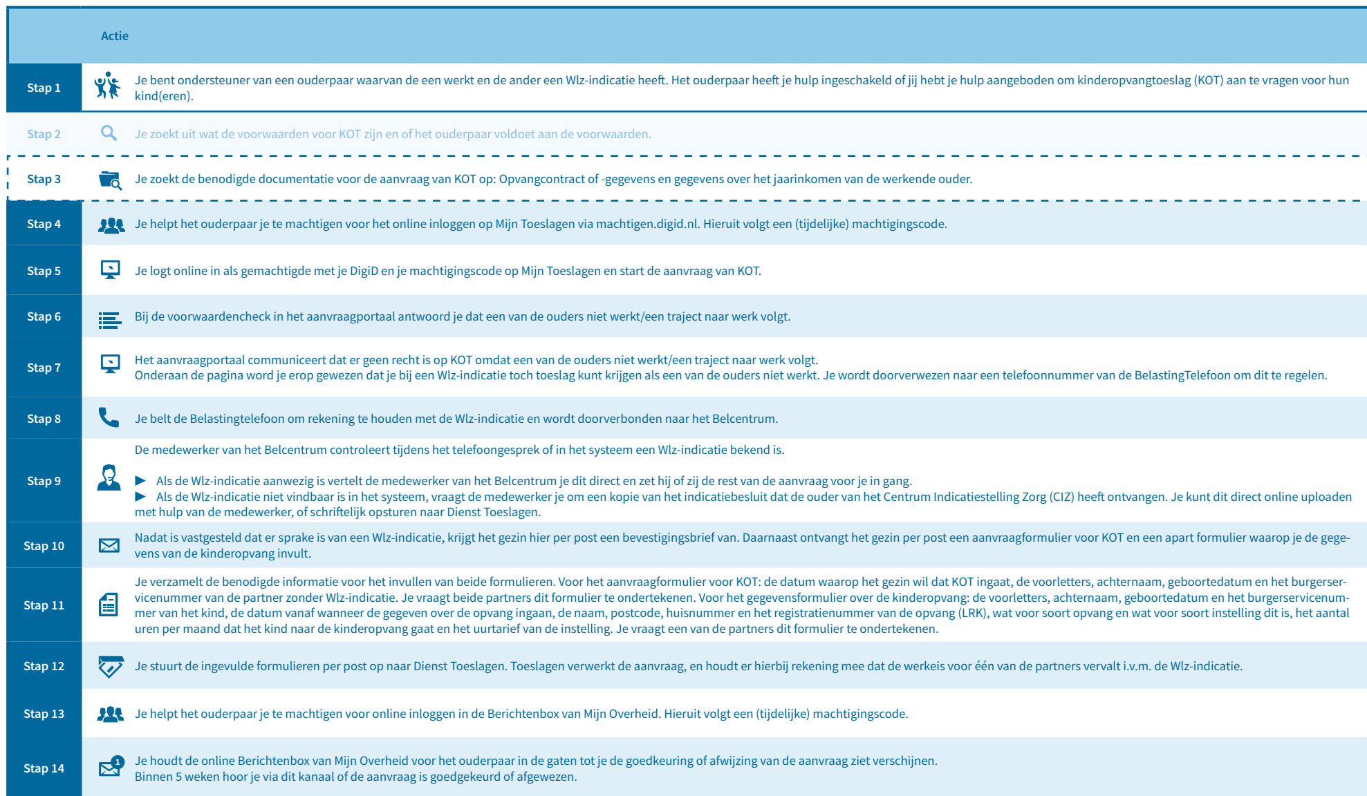
Afbeelding 2. KOT-aanvraagproces voor ondersteuners