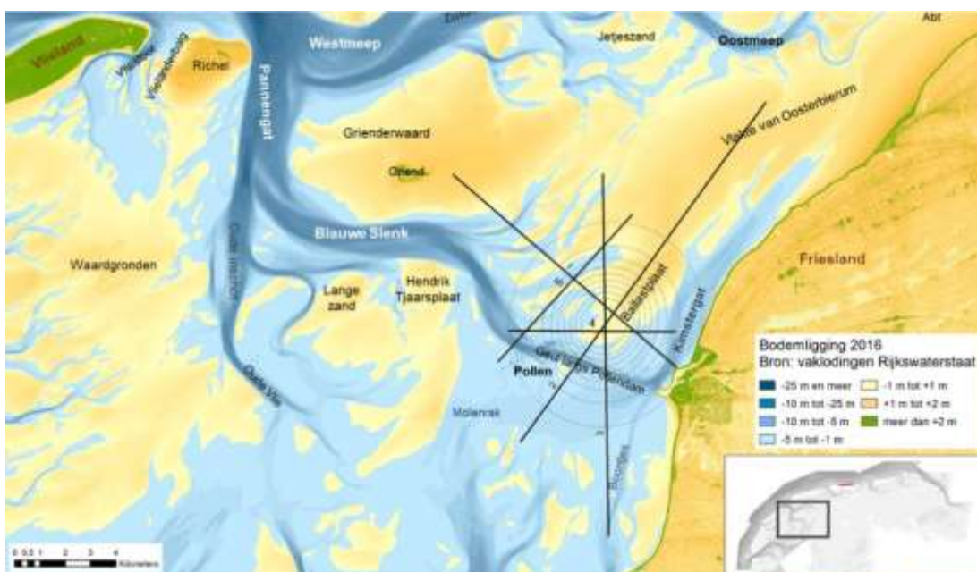
Figuur 1: Overzicht van het zoutwinningsgebied en waar de (Pleistocene) bodemdaling kan plaatsvinden. De lijnen geven de ligging van de verschillende raaimetingen aan.

Om te beoordelen of aan de voorwaarden voor de zoutwinning wordt voldaan, monitort Frisia op verschillende manieren de (veranderingen in) diepe bodemdaling, morfologie en natuur. Hiermee is gestart in 2018, ruim voordat de daadwerkelijke zoutwinning begon.