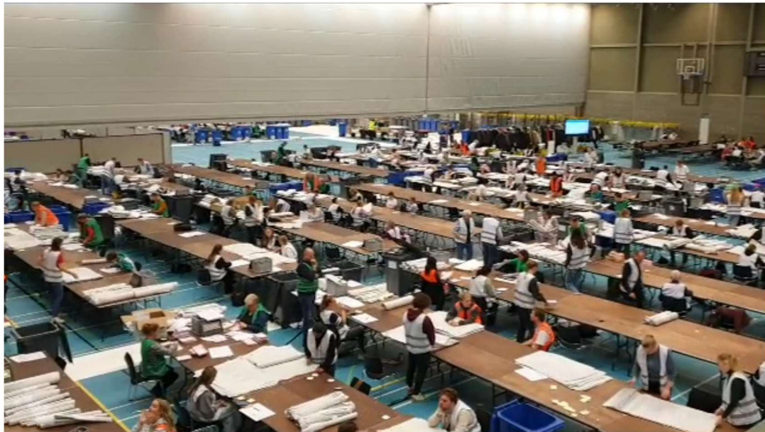
Figuur 3 - Sfeerimpressie uitvoering centrale stemopneming bij gemeentelijk stembureau Tilburg

werken. Resultaat van de hertelling was dat de telverschillen zo goed als opgelost waren, i.c. teruggebracht tot één of twee, en voor één stembureau zelfs tot nul.