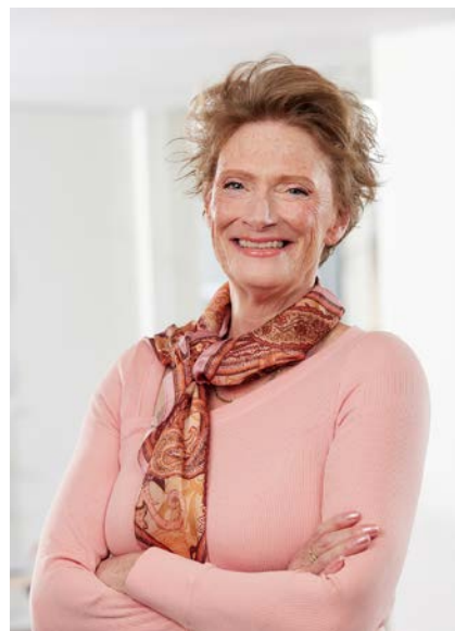
Alida Oppers Inspecteur-generaal van het Onderwijs

In De Staat van het Onderwijs schrijven we elk jaar over de kwaliteit van het onderwijs in Nederland. In dit jaarverslag verantwoorden we ons eigen werk in het afgelopen jaar. Dit doen we in de vorm van een beschrijving van de grote ontwikkelingen in ons toezicht, een overzicht van onze stelselonderzoeken en aantallen onderzoeken bij scholen en opleidingen en besturen.