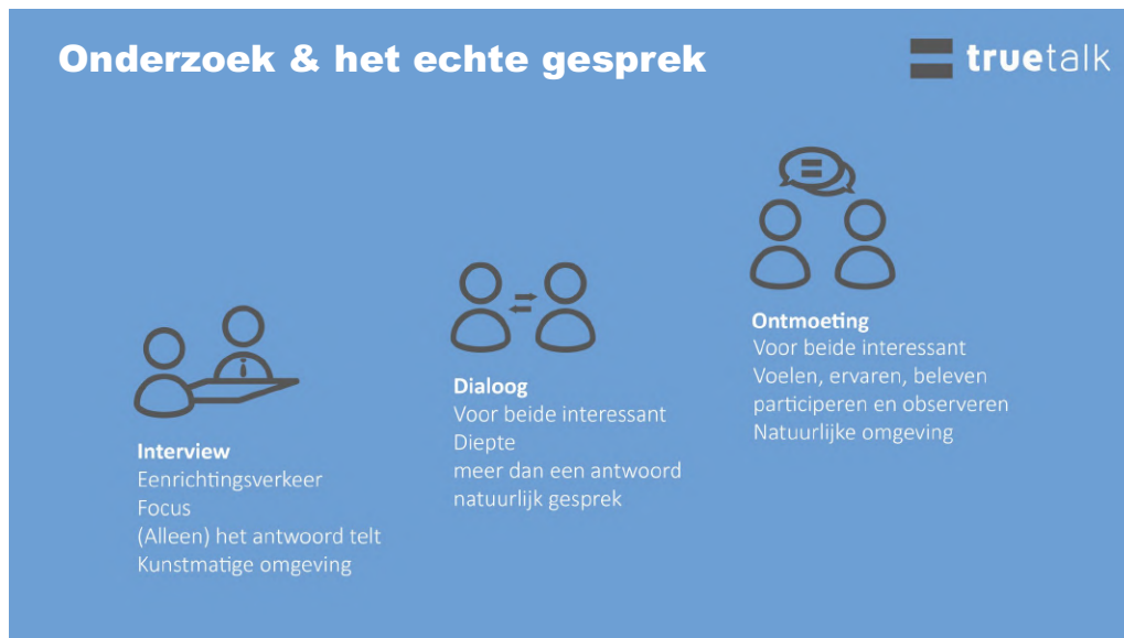
Figuur 1: Verschillen tussen interview en dialoog

Een diverse groep gesprekspartners betekent ruimte voor uiteenlopende verhalen en ervaringen. TrueTalk koos daarom voor de open dialoogvorm in plaats van strakke interviews. In een dialoogvorm kan iedereen die iets wil zeggen over het onderwerp namelijk daadwerkelijk zeggen wat hij of zij kwijt wil. Zo kan men tot een echt en natuurlijk gesprek te komen en het echte verhaal horen. Daarnaast geeft een dialoog de mogelijkheid om door te vragen op wat gesprekspartners vertellen en de diepte in te gaan. Bij interviews is de vragenlijst leidend en is er geen tot weinig ruimte om mee te kunnen bewegen met onderwerpen die voor de gesprekspartners belangrijk zijn.