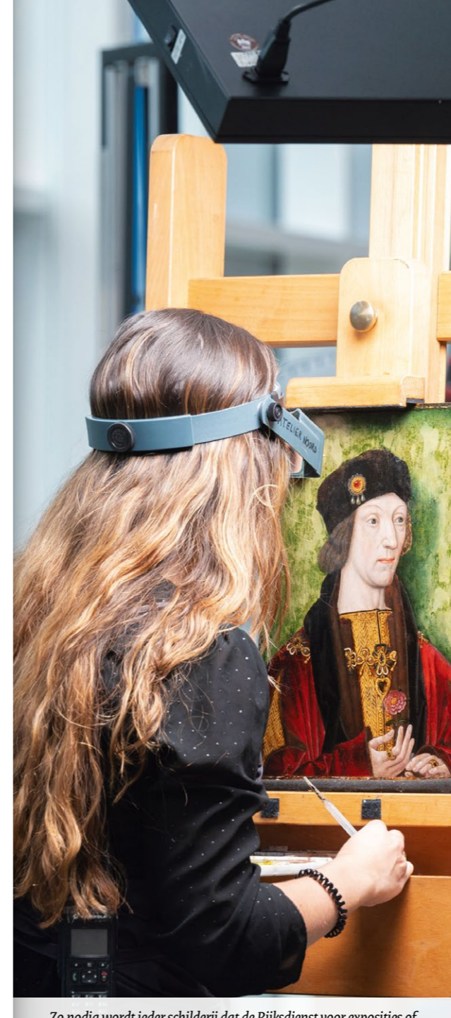
Zo nodig wordt ieder schilderij dat de Rijksdienst voor exposities of voor lange tijd uitleent eerst gerestaureerd, zoals dit koningsportret uit ongeveer 1525

Onze adviseurs werken intensief samen met gemeenten en provincies en met erfgoedinstellingen, zoals de Inspectie Overheidsinformatie en Erfgoed, provinciale steunpunten en museumconsulenten. Het streven is om antwoorden op individuele vragen en praktijkervaringen te verwerken tot relevante, ontbrekende kennis en adviezen.