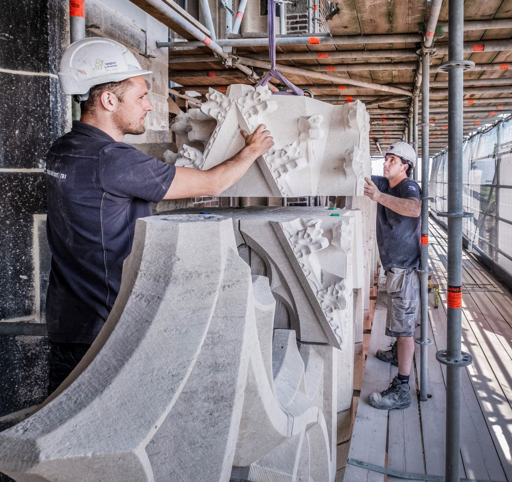
Foto cover: De Rijksdienst helpt eigenaren van archeologische rijksmonumenten, gemeenten en organisaties in de ruimtelijke ontwikkeling en de bouw om het verleden van de plek waaraan ze werken op waarde te schatten

Foto achter: Experts van de Rijksdienst ondersteunen ook met adviezen op bijvoorbeeld het gebied van schilderwerk, interieur, historisch glas en natuursteen. Zoals bij de grote restauratie van de Utrechtse Domtoren