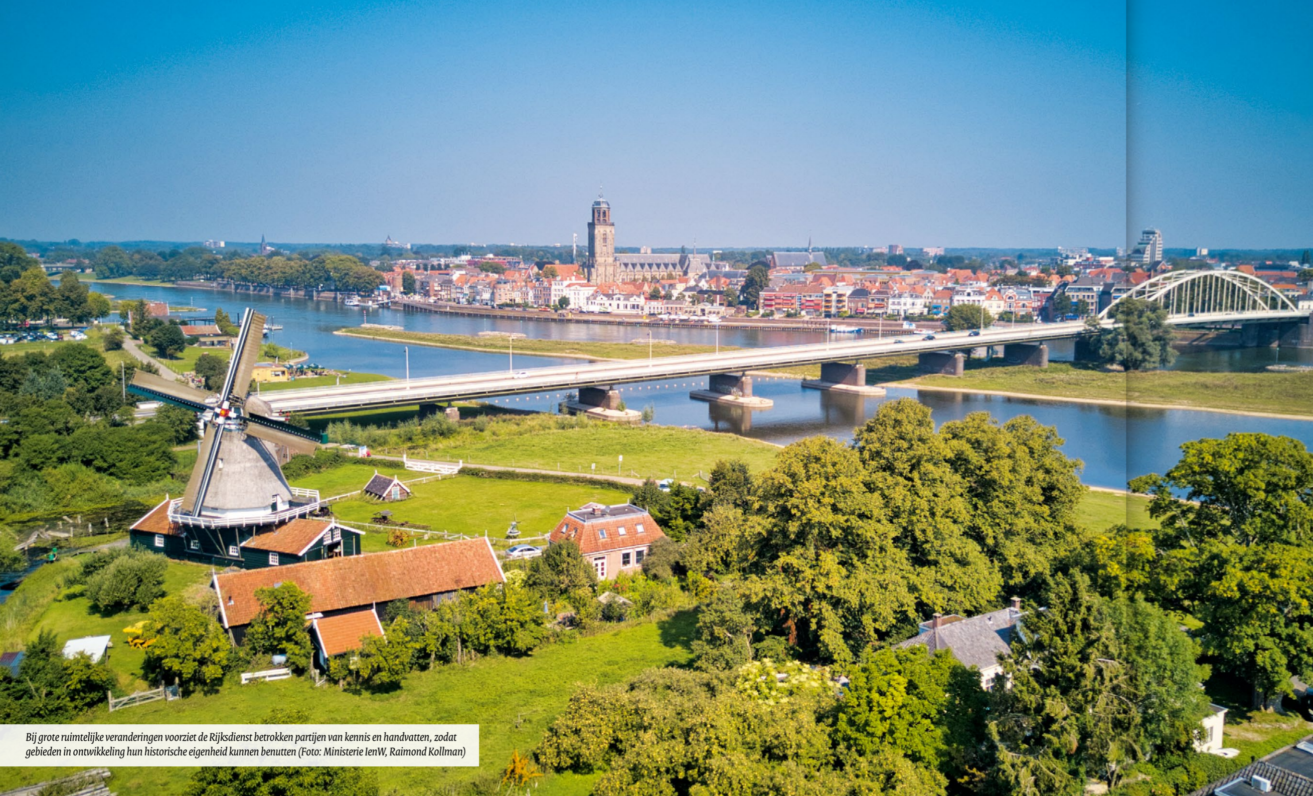
Bij grote ruimtelijke veranderingen voorziet de Rijksdienst betrokken partijen van kennis en handvatten, zodat gebieden in ontwikkeling hun historische eigenheid kunnen benutten