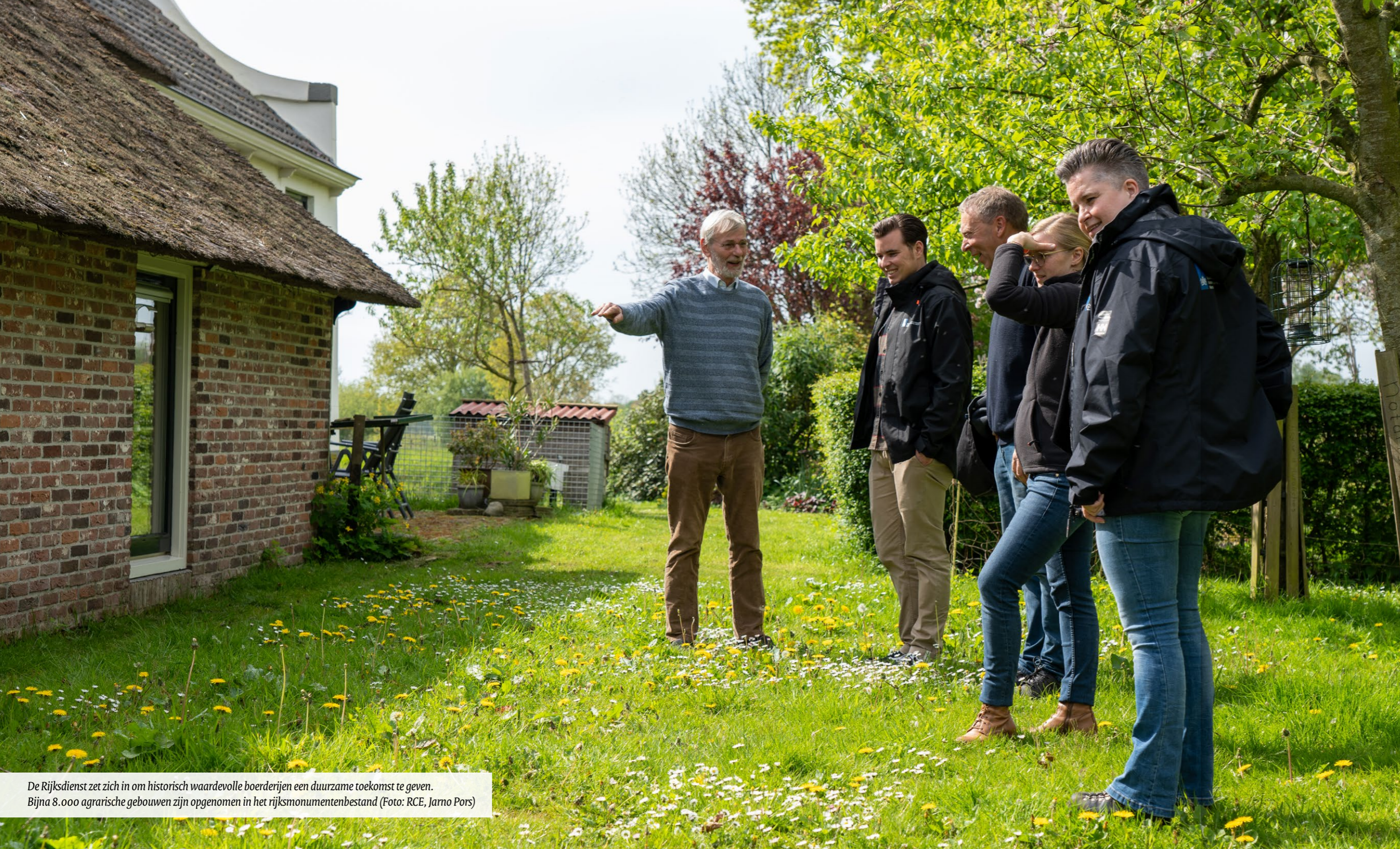
De Rijksdienst zet zich in om historisch waardevolle boerderijen een duurzame toekomst te geven. Bijna 8.000 agrarische gebouwen zijn opgenomen in het rijksmonumentenbestand