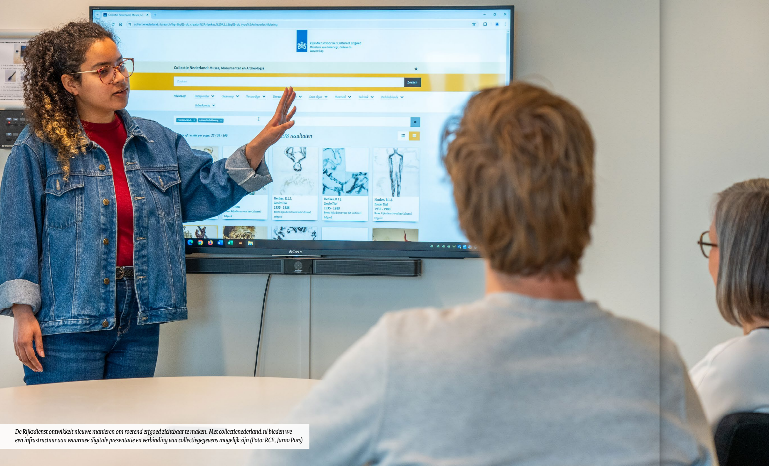
De Rijksdienst ontwikkelt nieuwe manieren om roerend erfgoed zichtbaar te maken. Met collectienederland.nl bieden we een infrastructuur aan waarmee digitale presentatie en verbinding van collectiegegevens mogelijk zijn