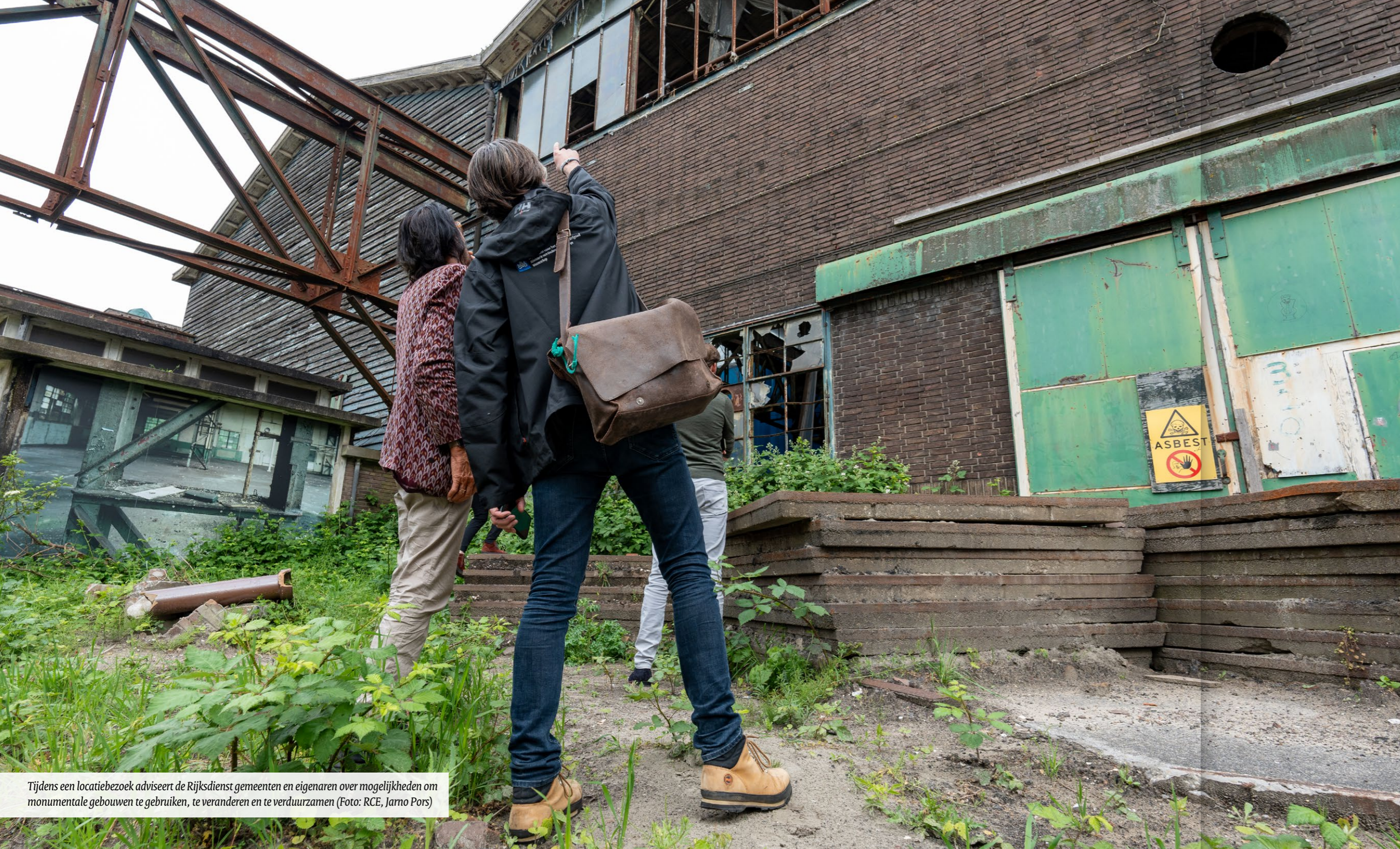
Tijdens een locatiebezoek adviseert de Rijksdienst gemeenten en eigenaren over mogelijkheden om monumentale gebouwen te gebruiken, te veranderen en te verduurzamen