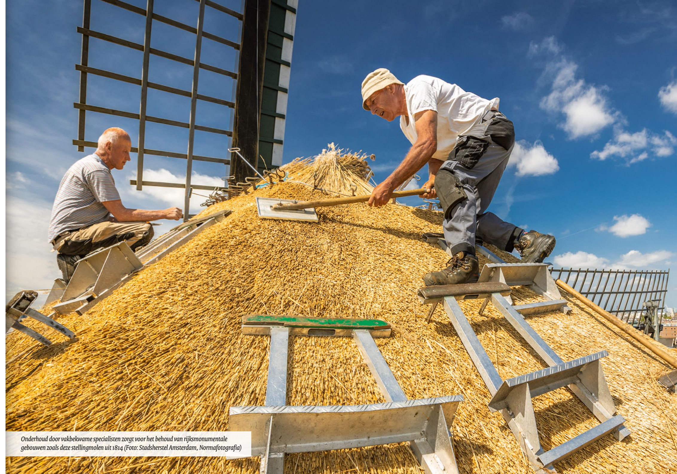
Onderhoud door vakbekwame specialisten zorgt voor het behoud van rijksmonumentale gebouwen zoals deze stellingmolen uit 1814

Lokale overheden zijn een cruciale partner voor de RCE en de samenwerking is in de basis goed. Gemeenten, provincies en waterschappen spelen een belangrijke rol bij het opstellen en uitvoeren van beleid en regelgeving met betrekking tot erfgoedbescherming en ruimtelijke ordening. We bieden ondersteuning en expertise aan deze overheden om hen te helpen bij het ontwikkelen van effectief erfgoedbeleid en bij het nemen van beslissingen over erfgoedkwesties.