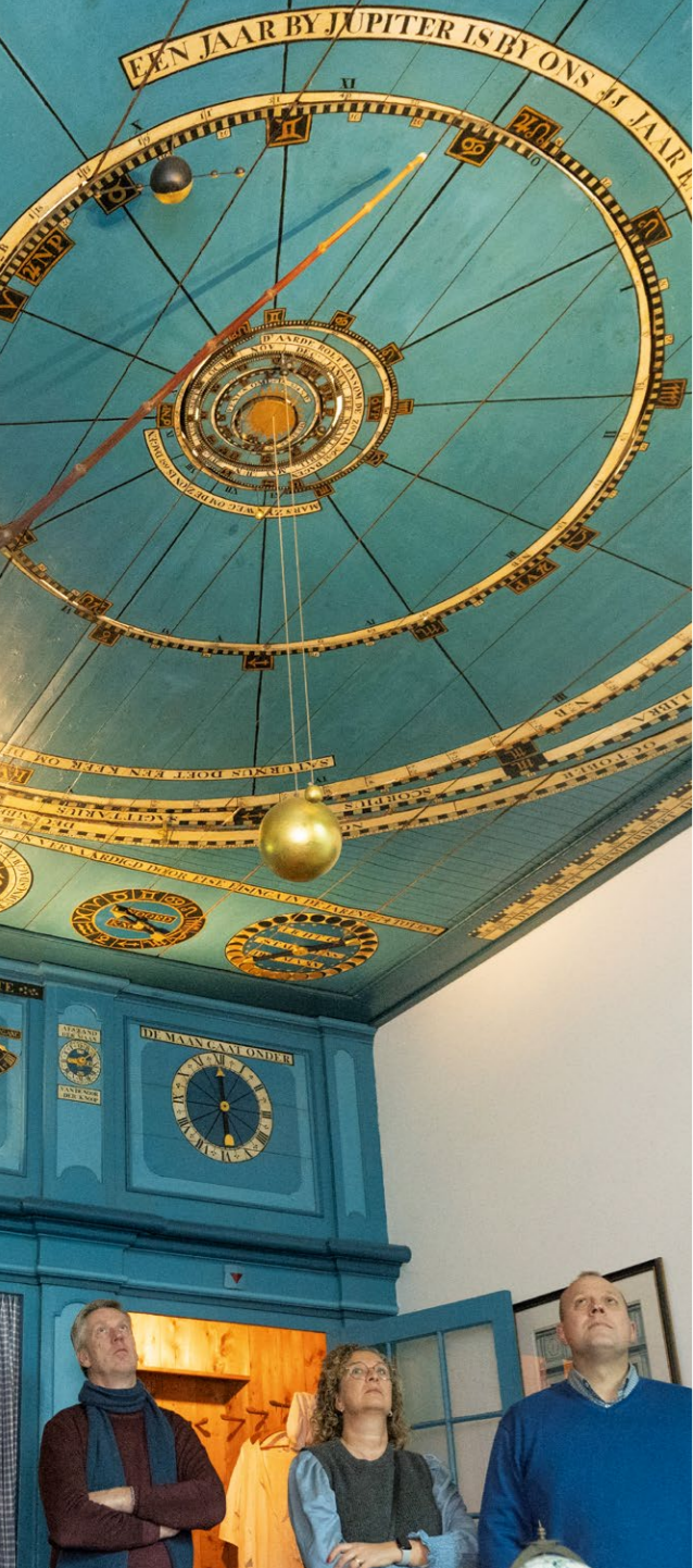
In 2023 is het rijksmonumentale Eise Eisinga Planetarium uit 1781 in Franeker als werelderfgoed erkend