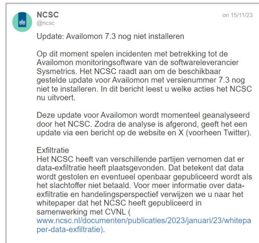
Fig. 1: Bericht van het NCSC verzonden tijdens de oefening, ter illustratie

Sectoren geven aan een landelijk beeld en een beeld van andere sectoren (en mogelijke keteneffecten) te hebben gemist. Sectorale Computer Emergency Response Teams (CERTS) vertegenwoordigen sectoren, zij hebben een lijn naar het NCSC. Vitale organisaties die getroffen zijn hebben op hun beurt (onder andere) contact met de betreffende veiligheidsregio of in een aantal gevallen direct met hun DCC (denk aan de financiële sector en organisaties met een systeemverantwoordelijkheid). De veiligheidsregio's hebben een lijn met het Landelijk Operationeel Coördinatiecentrum (LOCC), het Nationaal CrisisCentrum (NCC) en het Nationaal Kernteam Crisiscommunicatie (NKC). Dit zijn als het ware twee kolommen. Alle informatie (technisch, cyber gerelateerd, operationeel en over de impact) komt nu pas samen op rijksniveau, tijdens het IAO, terwijl deze beelden op sectoraal niveau al gekoppeld zouden moeten zijn. Er is op dit moment echter geen logische plek waar dit gebeurt. Een mogelijkheid zijn de Departementale Coördinatie Centra (DCC's) maar uit de oefening blijkt dat hier informatiedeling niet op zo'n manier plaatsvindt dat hier overkoepelende sectorale beelden ontstaan. Wanneer op sectoraal niveau geen compleet beeld kan worden gemaakt, zal dat ook op nationaal niveau onmogelijk blijken. Daarnaast liep de beeldvorming in het IAO nu achter op de actualiteit. Zo was een deel van de aanvallen, waaronder het wissen van de systemen en daarmee de ernst van de situatie, niet volledig inzichtelijk.