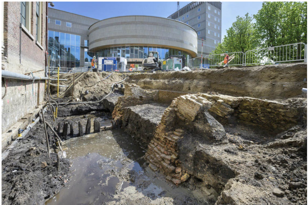
Fundamenten oude brug.

De archeologen zullen verder onderzoek doen naar de opbouw van de brug. Mogelijk zijn er nog oudere funderingen bewaard gebleven die meer inzicht geven in de ouderdom van de brug. Het is niet uit te sluiten dat er in de middeleeuwen al een brug aanwezig was. Een interessant aspect is dat de zijgracht waar de brug over liep al vroeg in de geschiedenis werd gedempt vanwege een nieuw waterafvoersysteem, waardoor de grachtvulling goed bewaard is gebleven.