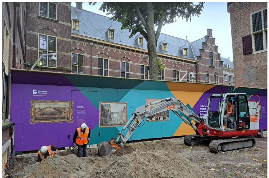
Archeologische opgravingen.

Ook in deze rapportageperiode is er op verschillende plekken archeologisch onderzoek uitgevoerd en zijn er weer bijzondere vondsten gedaan.