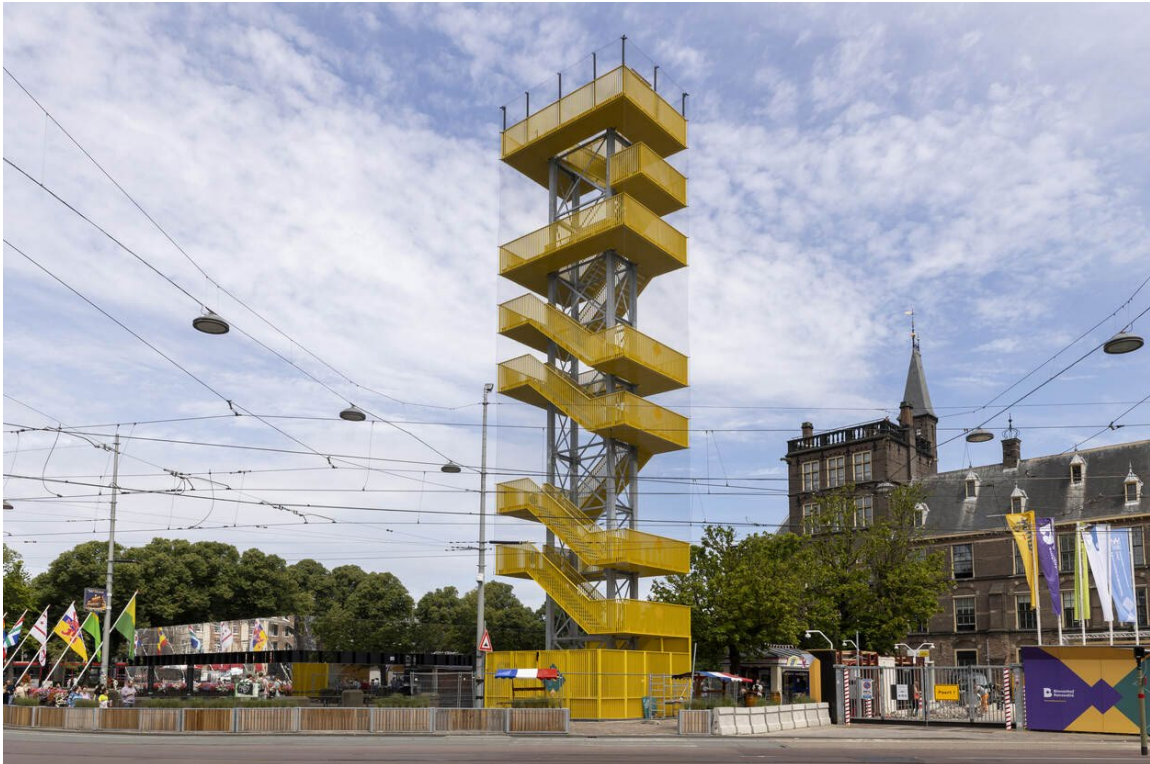
Uitzichtpunt Binnenhof renovatie.