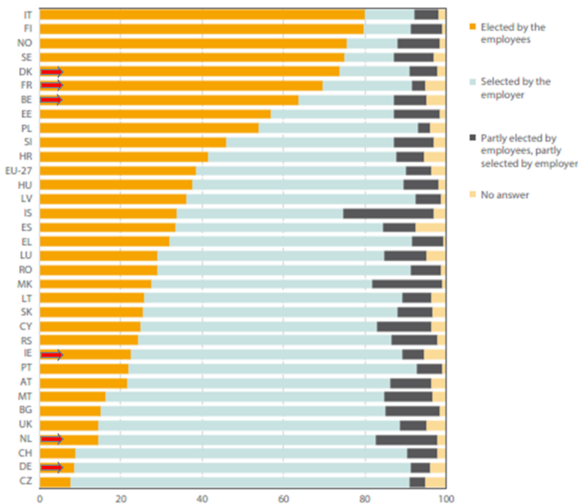
Figuur 3: Verkiezing preventiemedewerker door werkgever of werknemers in % (ESENER2019)