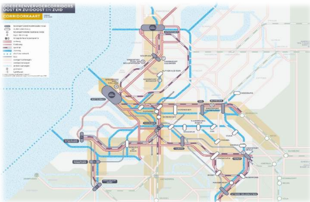
Overzichtskaart van de 3 GV-corridors

Om de multimodale ontwikkeling verder te versterken werken Rijk en regio op de corridors sinds twee jaar samen in praktische meerjarige Realisatiepacten van multimodale knooppunten (zie ook Regeerprogramma). Ook ruimtelijke problematiek (beter benutten van bedrijventerreinen, het juiste bedrijf op de juiste plaats) worden daarin meegenomen. Tilburg en Venlo zijn de voorlopers bij deze realisatiepacten waarbij IenW en Regio (aanjaag)middelen beschikbaar stellen. Nieuwe Realisatiepacten met Rotterdam, Amsterdam, North Sea Port/Zeeland, Moerdijk en Sittard-Geleen/Chemelot zijn onlangs gestart.