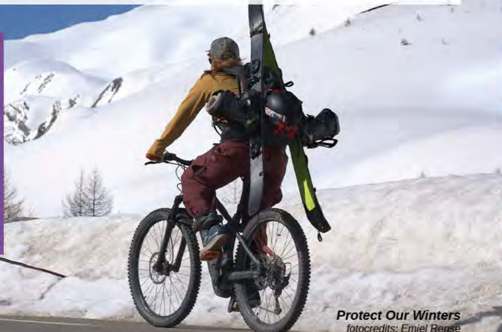
Protect Our Winters

Dus overheid: investeer in initiatieven die mensen informeren en betrekken. Maak dit op alle thema's tot overheidsbeleid. Bij alle campagnes die je als overheid lanceert, van Nationale Klimaatweek tot energiebespaarcampagnes: zorg dat initiatieven de boodschap (nog beter!) kunnen brengen.