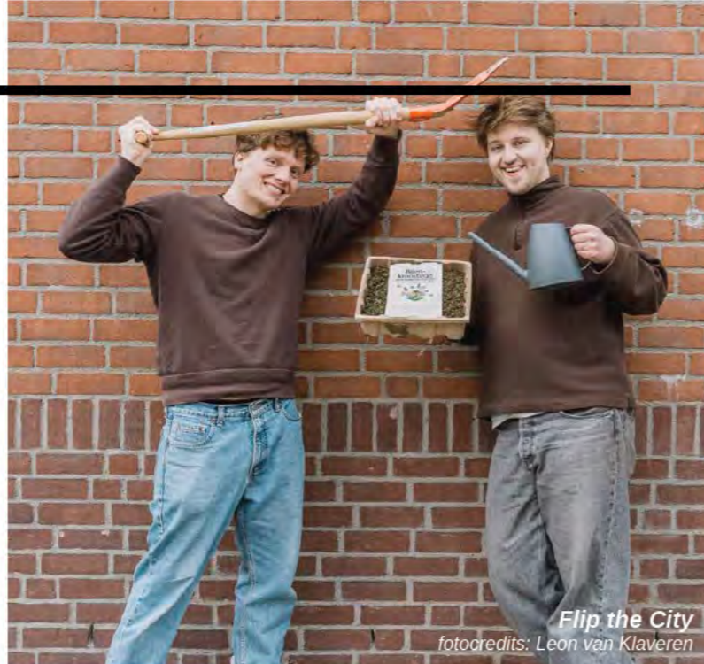
Flip the City

Om 'made in Holland' meer wind in de zeilen te geven helpt meer experimenteerimte. Als ergens groene groei zit, dan hier! De R&D afdeling van de samenleving heeft meer investeerders nodig, inkopers met lef, true pricing, CO2 beprijzing en het slimmer maken van regelgeving. Dat laatste ook specifiek in de bouw, rondom energieprestatie en materiaalgebruik (MPG en BENG).