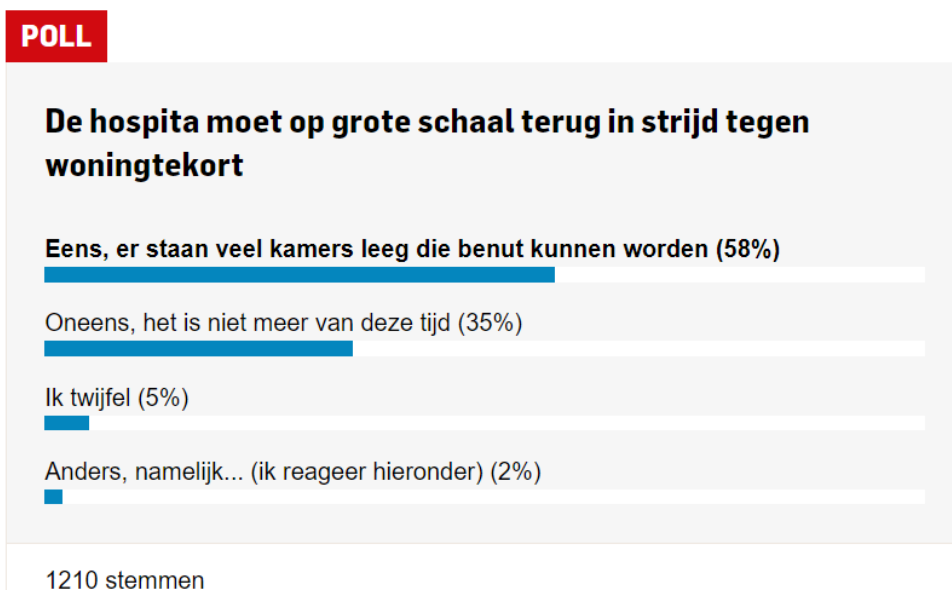
Afbeelding 3 Poll van dagblad De Stentor over hospitaverhuur

Uit het ‘Publieksonderzoek hospitaverhuur’, in opdracht van het ministerie van BZK (nr. 2.) 43 blijkt dat 29% van de Nederlanders (zeer) positief staat ten opzichte van hospitaverhuur. Eveneens 29% staat er (zeer) negatief tegenover en 36% neutraal. Uit het onderzoek blijkt ook dat een derde van de Nederlanders aangeeft een kamer groter dan 12 m 2 beschikbaar te hebben (eigenaren 40% en huurders 22%). Verder overweegt 8% (waarschijnlijk/zeker) hospitaverhuur. Belangrijkste motieven: extra inkomsten en verlichten van de woningnood.