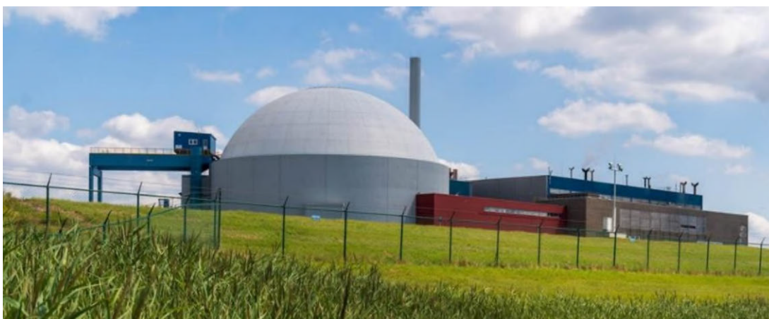
Figuur 1, Kerncentrale Borssele.

Het milieueffectrapport (hierna: MER) hiervoor is opgesplitst, en bestaat uit twee delen. Het MER eerste fase (deel 1) brengt de milieugevolgen van de wetwijziging in beeld. Bij een positief besluit hierover kan EPZ een wijzigingsvergunning aanvragen. De huidige Wet verbiedt namelijk het in behandeling nemen van een vergunningaanvraag. 3 Het MER tweede fase (deel 2) brengt de mogelijke milieugevolgen van een vergunningaanvraag dan later in beeld. De minister van Infrastructuur en Waterstaat (hierna: IenW) heeft de Commissie voor de milieueffectrapportage gevraagd te adviseren over de juistheid en volledigheid van deel 1 van het MER (verder in dit advies het MER genoemd, tenzij anders vermeld).