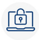
Computers hacken/ internetkabel onderzoeken