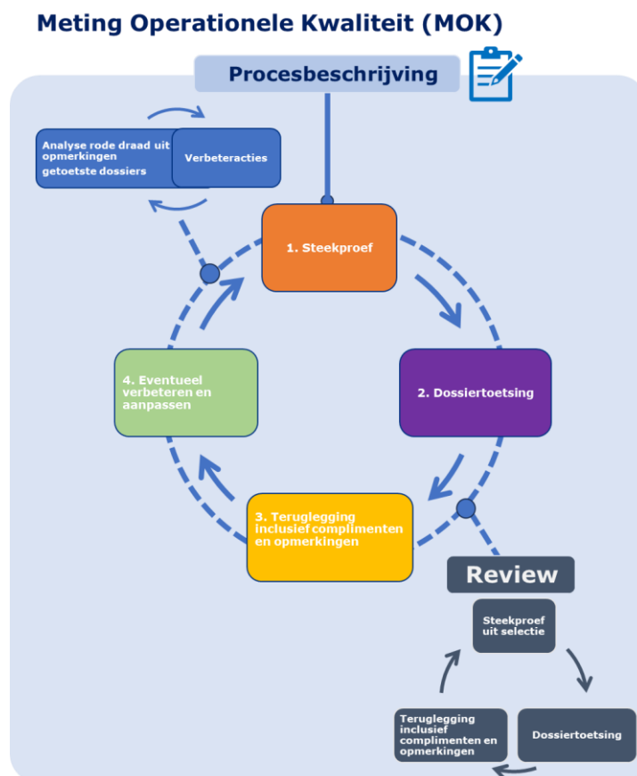
Figuur 4 MOK procesbeschrijving

De MOK's zijn standaard onderzoeken over de gehele sociaal-medische dienstverlening en worden periodiek uitgevoerd. Gerichte kwaliteitsonderzoeken 22 worden in risico-gericht ingezet. Deze onderzoeken zijn specifiek gericht op onderdelen van het sociaal-medisch beoordelen. Jaarlijks wordt een onderzoekskalender vastgesteld op basis van signalen uit de MOK's of andere signaleerde risico's. Qua uitvoering van de methode is het belangrijkste verschil dat gerichte kwaliteitsonderzoeken alleen door de kwaliteitsonderzoekers van de landelijke afdeling BC&K verricht worden, zonder kruiselingse controles in de districten. Vice versa spelen de kwaliteitsonderzoekers geen rol in de MOK behalve in de 'overcontrole'.