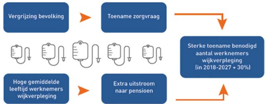
Figuur 1: Arbeidsmarktprognose wijkverpleging 2018-2027.

Daarnaast heeft bureau Berenschot in een kwalitatief onderzoek gekeken naar de beweegredenen van nieuwe aanbieders om in de wijkverpleging te starten (zie bijlage). Dit omdat de sector wijkverpleging relatief veel nieuwe zorgaanbieders kent. De uitkomsten van dit onderzoek worden eveneens meegenomen in de afspraken binnen het HLA over specifieke maatregelen voor de wijkverpleging.