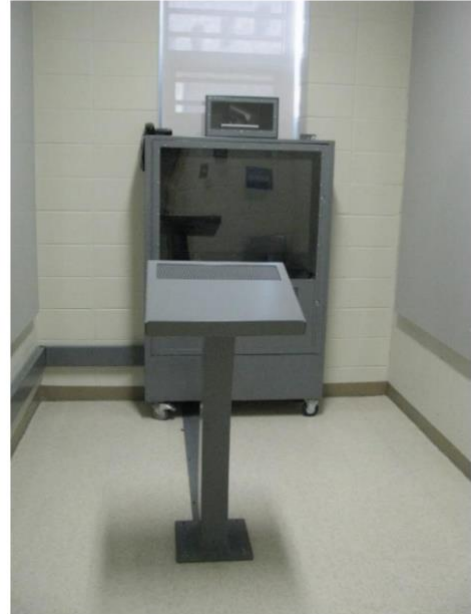
Afbeelding 3: Ruimte in een detentiecentrum in Québec voor de videoverschijning van de verdachte ter terechtzitting. Deze ruimte staat in verbinding met de rechtszaal.

Tijdens de zitting kan de advocaat de rechter verzoeken 481 om de zitting te schorsen voor een video-gesprek in de visioparloir tussen verdachte en advocaat. 482 Als de rechter instemt, moeten de advocaat en de verdachte beiden verhuizen naar de visioparloirs . Verder kan de advocaat ook buiten de zitting om via een online reserveringssysteem visioparloirs reserveren voor overleg met zijn cliënt: een in het detentiecentrum voor de cliënt en een visioparloir in de rechtbank van Québec voor zichzelf. 483 Advocaten kunnen ook een videoconferentiesysteem op hun kantoor kunnen installeren, waarmee zij, nadat ze dit via het reserveringssysteem hebben aangevraagd, direct verbinding kunnen maken met een visioparloir in een detentiecentrum. 484