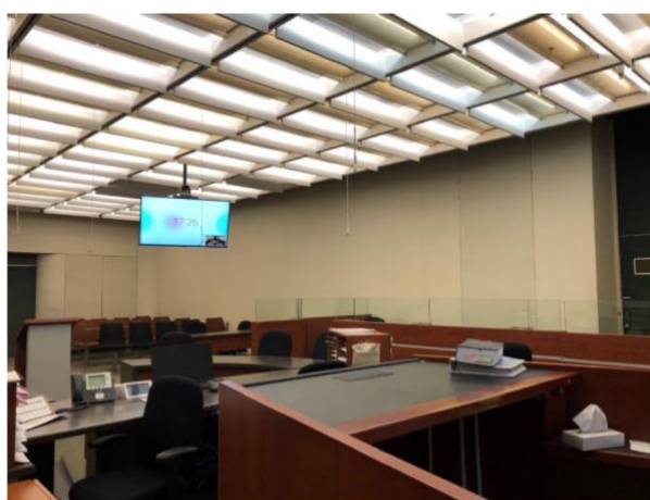
Afbeelding 1: Één van de rechtszalen van de rechtbank van

Alle videobezoekkamers (zowel die in de gerechtsgebouwen als die in de