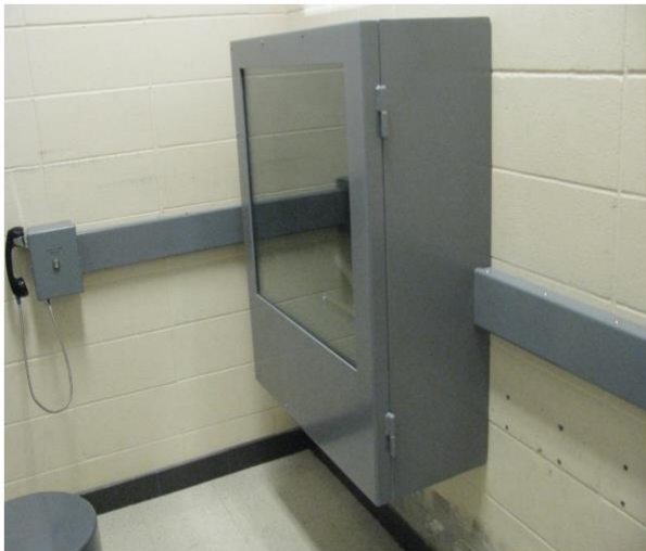
Afbeelding 4: Visioparloir in een detentiecentrum in Québec. Deze staat in verbinding met de visioparloir voor de advocaat in de rechtbank.

Naast investeringen in apparatuur, is er ook aandacht geweest voor training van het personeel om de apparatuur te bedienen maar ook over de gang van zaken tijdens het verhoor via videoconferentie. Bijvoorbeeld hoe de verdachte tijdens de zitting naar de visioparloir kan worden begeleid indien er