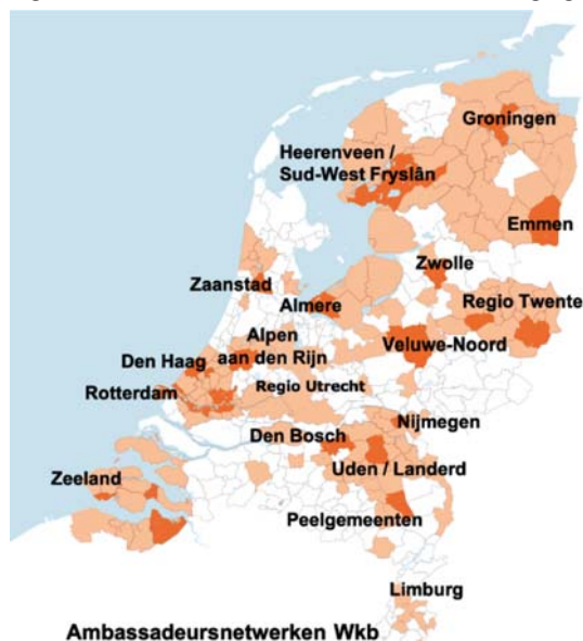
Figuur 1: Ambassadeursnetwerken kwaliteitsborging (stand 1-8-2021)

Ten opzichte van het overzicht dat ik u op 22 februari van dit jaar heb toegezonden is het aantal proefprojecten met 178 toegenomen en is het aantal integrale proefprojecten ruim verdubbeld. Een groot deel van de projecten vindt plaats binnen de Ambassadeursnetwerken. Inmiddels zijn 18 geplande netwerken gestart (zie de kaart hiernaast) en start mogelijk in de Bollenstreek nog een 19e netwerk. Daarmee neemt ruim de helft van alle gemeenten deel aan één van de netwerken en kan zo ervaring op doen met kwaliteitsborging.