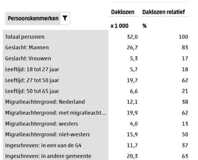
Tabel: aantal daklozen in 2021

Het aantal daklozen is in 2021 afgenomen. Volgens cijfers van het CBS waren in 2020 36,4 duizend mensen dakloos.