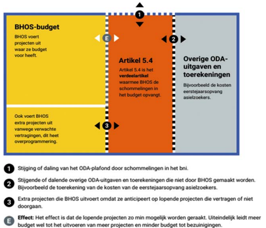
Figuur 3: Illustratie werking verdeelartikel 5.4, overgenomen van het Verantwoordingsonderzoek 2020 van de Algemene Rekenkamer. 1