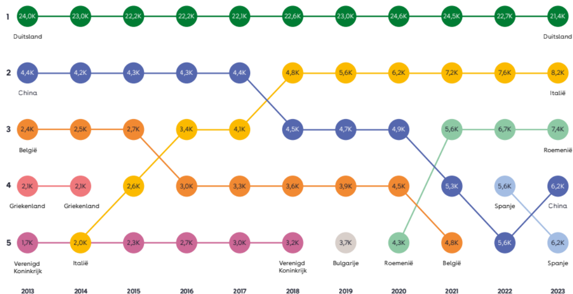
Figuur 3: Verandering in de top 5 herkomstlanden van internationale studenten met de jaarlijkse totalen per land. 88

Daarnaast vragen deze leden of er in de landen waarvan de instroom de afgelopen jaren sterk is gestegen nog steeds expliciet studenten worden geworven.