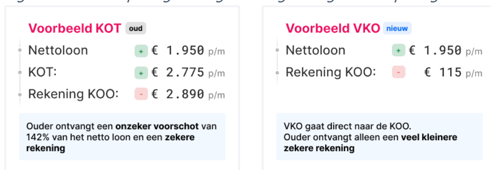
Figuur 2: kinderopvangtoeslag vs. vergoeding kinderopvang

In het nieuwe financieringsstelsel wordt niet meer teruggevorderd bij ouders. Dit is mogelijk doordat het stelsel inkomensonafhankelijk wordt, kinderopvangorganisaties verantwoordelijk worden voor het aanleveren van het aantal opvanguren, de daarbij behorende uurprijs en wijzigingen daarin en doordat de toetsing op de arbeidseis alleen naar de toekomst toe gevolgen heeft. Hierdoor wordt de hoofddoelstelling van het nieuwe stelsel bereikt: een eenvoudig stelsel en meer zekerheid voor ouders.