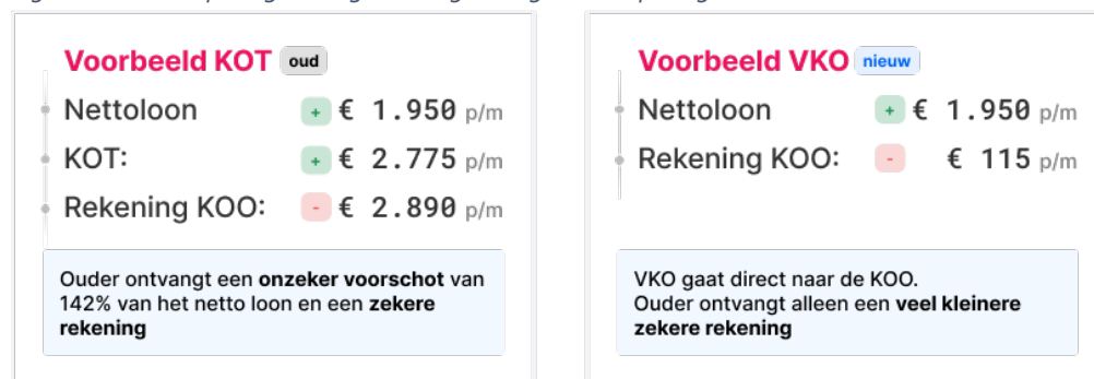
Figuur 2: kinderopvangtoeslag vs. vergoeding kinderopvang

In het nieuwe financieringsstelsel wordt niet meer teruggevorderd bij ouders. Dit is mogelijk doordat het stelsel inkomensonafhankelijk wordt, kinderopvangorganisaties verantwoordelijk worden voor het aanleveren van het aantal opvanguren, de daarbij behorende uurprijs en wijzigingen daarin en doordat de toetsing op de arbeidseis alleen naar de toekomst toe gevolgen heeft. Hierdoor wordt de hoofddoelstelling van het nieuwe stelsel bereikt: een eenvoudig stelsel en meer zekerheid voor ouders.