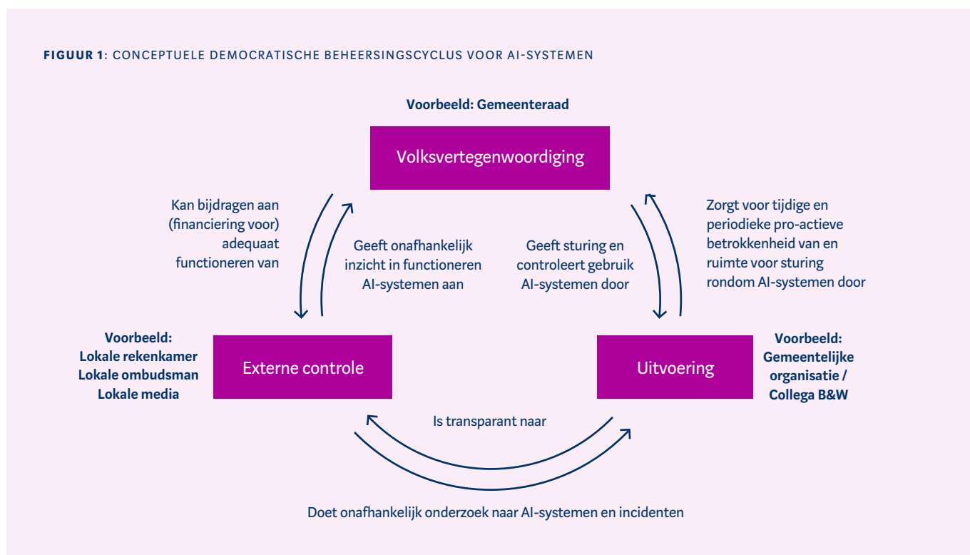
FIGUUR 1: CONCEPTUELE DEMOCRATISCHE BEHEERSINGSCYCLUS VOOR AI-SYSTEMEN

De adviezen in dit paper zijn grotendeels gebaseerd op onderzoek van de AP naar democratische beheersing op algoritmes en AI op gemeenteniveau. Veel conclusies uit dit onderzoek zijn ook van toepassing op regionale en landelijke overheden. Het hele onderzoek is te vinden in de Rapportage AI- & Algoritmico's Nederland ( editie 3: zomer 2024 ). 2