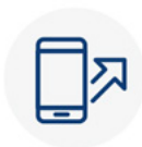
Telefoons af luisteren