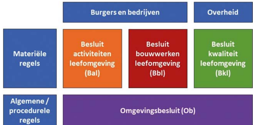
Figuur 1.1: De indeling van de AMvB's

De indeling van de AMvB's naar doelgroepen en type regels is gevisualiseerd in figuur 1.1.