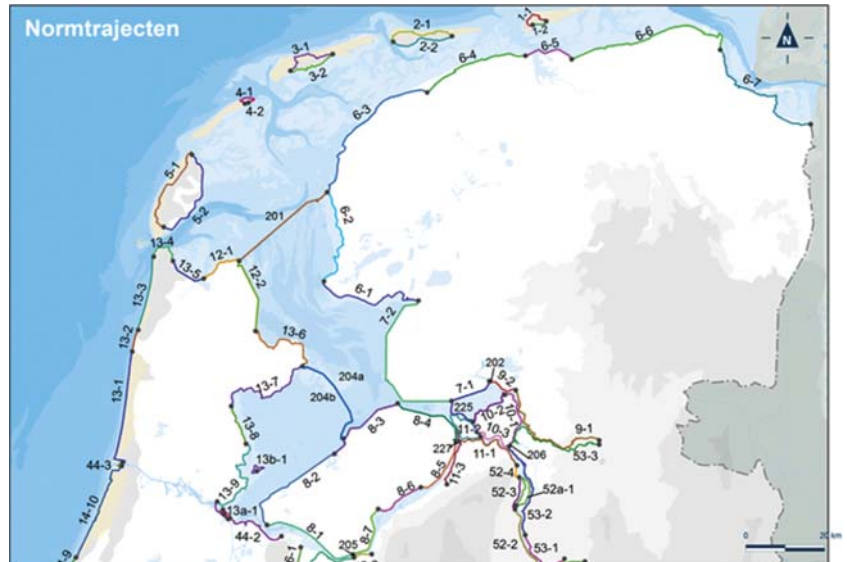
Kaart 1: Noord-Nederland

1. Kaart 1: Noord Nederland wordt vervangen door: