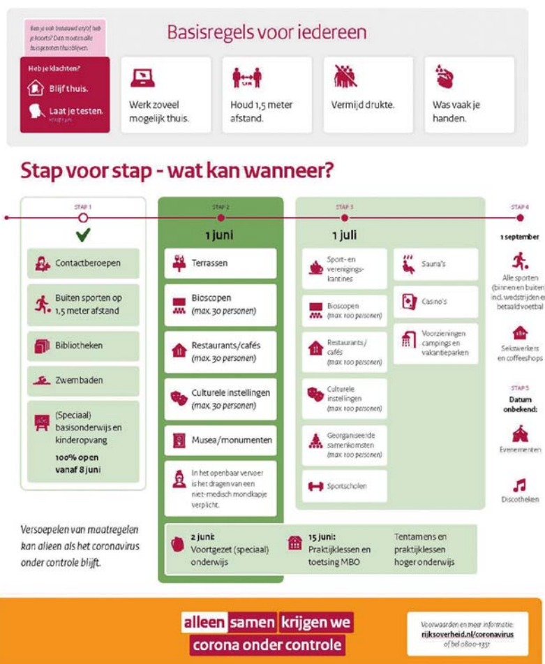
Figuur 1. Routekaart met stapsgewijze versoepeling van de maatregelen.