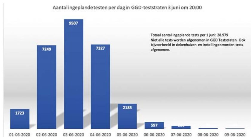
Figuur 3. Aantal ingeplande testen per dag in GGD-teststraten

Ik informeer u graag kort over het verloop van de eerste dagen testen. Het speciale telefoonnummer waarmee mensen met coronaklachten een testafspraak kunnen maken is in de afgelopen twee dagen in groten getale gebeld. De toestroom op 0800-1202 was zo groot, dat de systemen overbelast raakten en mensen niemand te spreken kregen of in een (te) lange wachtrij werden geplaatst. De technische knelpunten zijn in de loop van de ochtend, mede door goed overleg met Nederlandse telecomproviders, snel opgelost. Op dit moment is er geen sprake meer van lange wachttijden of onderbroken telefoontjes en kunnen mensen snel worden ingepland voor een testafspraak. Op het moment van schrijven zijn er bijna 29.000 afspraken gemaakt voor het afnemen van een test. Een deel van de bellers bleek met een ander doel te bellen; met name de behoefte aan informatie over COVID-19 is groot. Deze mensen zijn doorverwezen naar de juiste informatiekanaalen.