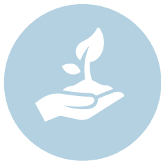
Klimaatverandering en milieu