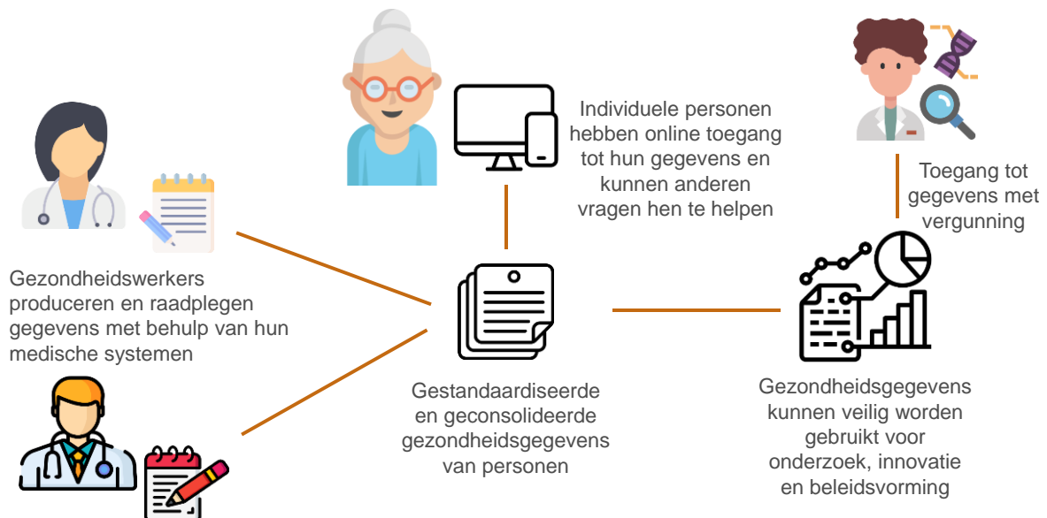
Figuur 3 — Primair en secundair gebruik van elektronische gezondheidsdossiers

Voor de ontwikkeling van een werkelijk gemeenschappelijke Europese ruimte voor gezondheidsgegevens zijn maatregelen op nationaal en EU-niveau nodig, alsmede nauwe samenwerking tussen publieke en private belanghebbenden (bijvoorbeeld nationale digitale gezondheidsinstanties, volksgezondheidsinstellingen, gegevensbeschermingsautoriteiten, zorgaanbieders, gezondheidswerkers, academische en onderzoeksinstituten en patiëntenverenigingen).