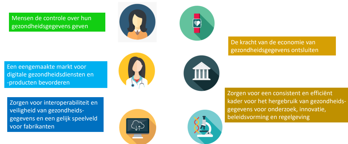
Figuur 1 — Belangrijkste doelstellingen van de Europese ruimte voor gezondheidsgegevens

Om het potentieel van gezondheidsgegevens te benutten, presenteert de Commissie een wetgevingsvoorstel om een Europese ruimte voor gezondheidsgegevens tot stand te brengen, personen zeggenschap over hun eigen gezondheidsgegevens te geven en het gebruik van die gegevens mogelijk te maken voor een betere gezondheidszorg, en om de EU in staat te stellen ten volle gebruik te maken van het potentieel dat wordt geboden door een veilige en beveiligde uitwisseling, gebruik en hergebruik van gezondheidsgegevens, zonder de huidige belemmeringen.