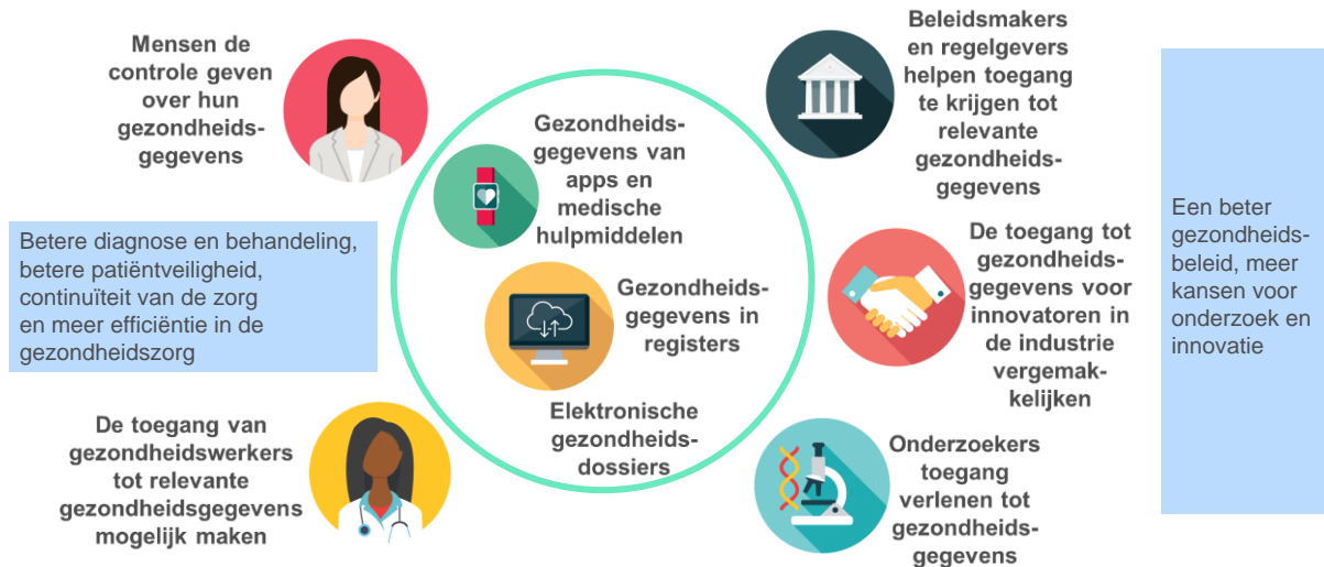
Figuur 4. Voordelen voor gebruikers van de Europese ruimte voor gezondheidsgegevens

De Europese ruimte voor gezondheidsgegevens zal voordelen opleveren voor individuele personen, gezondheidswerkers, zorgverleners, onderzoekers, regelgevers en beleidsmakers.