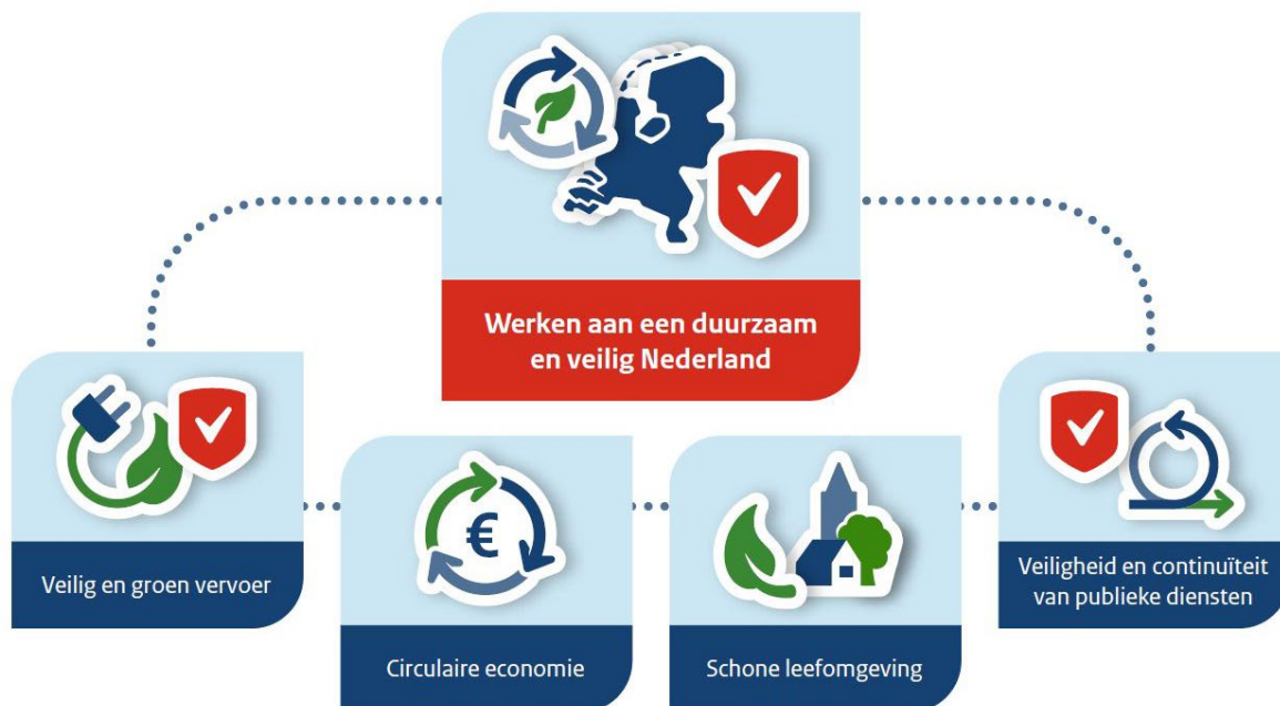
Afbeelding 2: Werken aan een duurzaam en veilig Nederland

De onderwerpen zijn in vier thema's verdeeld om de onderlinge samenhang zichtbaar te maken. Deze thema's zijn gebaseerd op de door het ministerie van IenW gedefinieerde maatschappelijke opgaven en transities en laten zien hoe de ILT daaraan een bijdrage levert.