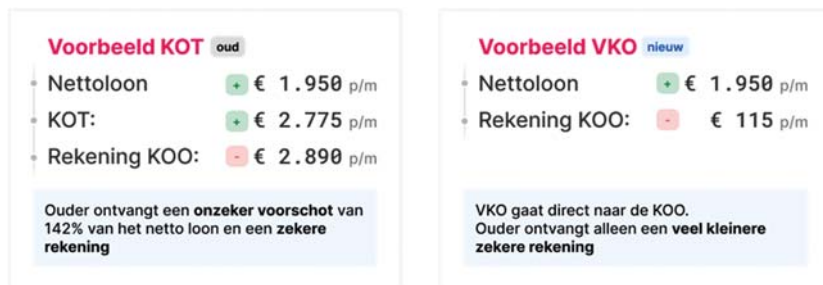
Figuur 2: kinderopvangtoeslag vs. vergoeding kinderopvang

In het nieuwe financieringsstelsel wordt niet meer teruggevorderd bij ouders. Dit is mogelijk doordat het stelsel inkomensonafhankelijk wordt, kinderopvangorganisaties verantwoordelijk worden voor het aanleveren van het aantal opvanguren, de daarbij behorende uurprijs en wijzigingen daarin en doordat de toetsing op de arbeidseis alleen naar de toekomst toe gevolgen heeft. Hierdoor wordt de hoofddoelstelling van het nieuwe stelsel bereikt: een eenvoudig stelsel en meer zekerheid voor ouders.