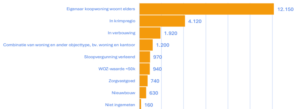
Figuur 3. Mogelijke verklaringen structurele leegstand na energiecorrectie, in aantallen woningen die aan één of meer verklarende kenmerken voldoen

Hiermee geef ik invulling aan de toezegging aan mevrouw Beckerman over een onderzoek naar verklarende kenmerken bij structureel leegstaande woningen voor het einde van 2024, gedaan tijdens het commissiedebat over ruimtelijke ordening van 2 oktober 2024 (TZ202410-049).