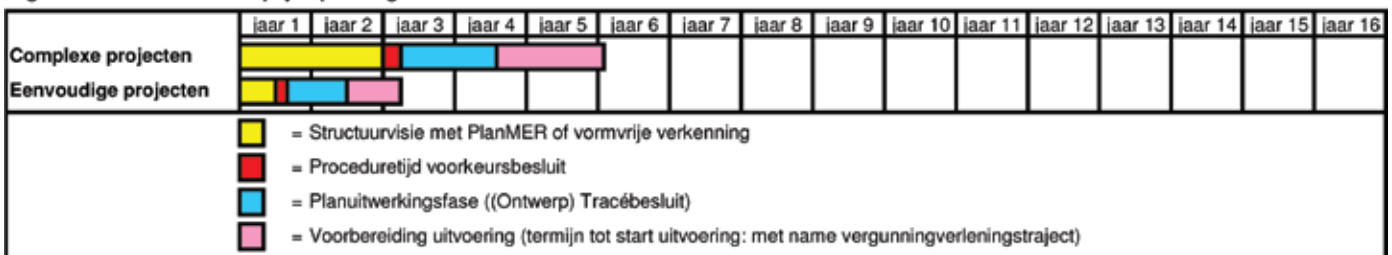
Figuur 2: voorziene doorlooptijd oplossingen

In dit hoofdstuk presenteert de commissie een drastische aanpassing van het besluitvormingsproces. De commissie heeft in beeld laten brengen wat haar voorstel kan opleveren in termen van doorlooptijd (zie figuur 2). Op basis daarvan komt de commissie tot de conclusie dat indien het advies integraal wordt uitgevoerd een halvering van de doorlooptijd van het besluitvormingsproces mogelijk is. Dit gaat echter niet vanzelf 5 en zal dan ook een doelstelling moeten zijn van de overheid. De grootste winst wordt bereikt door een gedegener verkenningfase die wordt afgesloten met een politiek gedragen voorkeursbesluit. Daardoor kan de huidige instabiele planstudiefase vervangen worden door een veel kortere 'planuitwerkingsfase' gericht op het uitwerken van het voorkeursalternatief, waarna het tracébesluit snel wordt genomen. Hierna wordt per fase het aangepaste besluitvormingsproces beschreven.