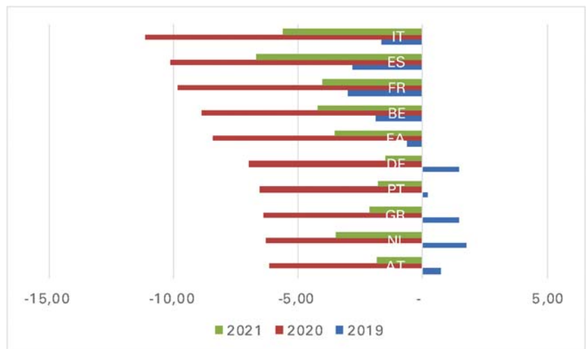
Grafiek 2: EMU-saldo (%bbp) selectie EU-landen, 2019–2021

bron: ECB, Economic Bulletin 2020/4 juni.