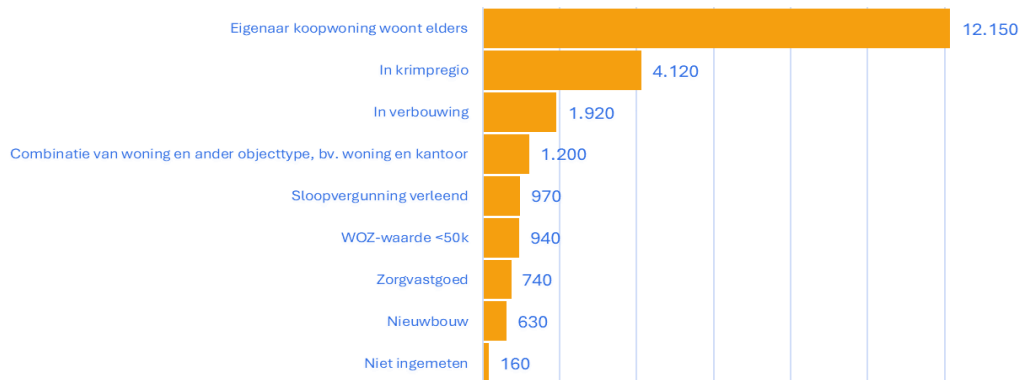
Figuur 3. Mogelijke verklaringen structurele leegstand na energiecorrectie, in aantallen woningen die aan één of meer verklarende kenmerken voldoen (bron: Leegstandmonitor 2024, CBS, 29 november 2024; bewerking RIGO)

Hiermee geef ik invulling aan de toezegging aan mevrouw Beckerman over een onderzoek naar verklarende kenmerken bij structureel leegstaande woningen voor het einde van 2024, gedaan tijdens het commissiedebat over ruimtelijke ordening van 2 oktober 2024 (TZ202410-049).