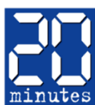
20 Minutes, France