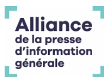
Alliance de la Presse d'Information Générale, France