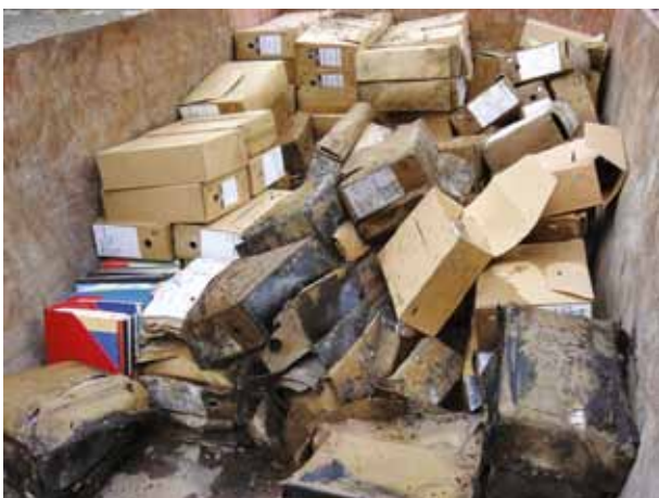
Brand Technische Universiteit Delft

De archiefruimte voldeed niet aan alle archiefwettelijke eisen. Er was geen calamiteitenplan voor de archieven opgesteld. Men beschikte niet over een volledig en betrouwbaar bestandsoverzicht van de aanwezige archieven. De universiteit brengt in kaart welke archiefdelen de brand hebben doorstaan en hoe deze hersteld kunnen worden. De Erfgoedinspectie ziet erop toe dat adequate maatregelen worden getroffen.