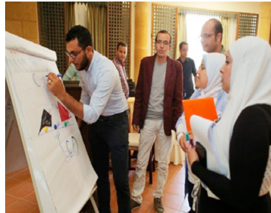
Deelnemers in gesprek tijdens workshop van de ngo Coptic Evangelical Organization for Social Services (CEOSS)

zijn drie projecten geïdentificeerd en gefinancierd die elkaar versterken. Ze richten zich op het stimuleren van de dialoog tussen religieuze en sociale groepen en het beschermen van vervolgte minderheden d.m.v. rechtsbijstand en verlenen van onderdak. Zo geeft de ngo Centre for Legal Aid, Assistance and Settlement (CLAAS) onderdak en rechtshulp aan religieuze minderheden die bedreigd worden. Het project zal aan circa 80 personen onderdak kunnen bieden en rechtshulp geven bij 100 rechtszaken.