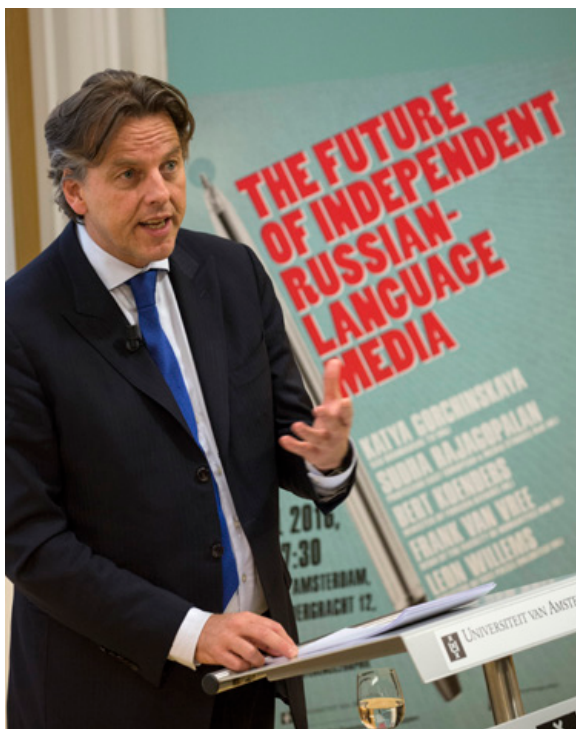
Minister Koenders spreekt tijdens de conferentie The Future of independent Russian-language media bij de Universiteit van Amsterdam.

De Nederlandse inzet bestrijkt ook het bevorderen van een gevarieerd medialandschap zodat burgers een geïnformeerde keuze kunnen maken. Persvrijheid en een gebalanceerd medialandschap zijn voorwaarden voor een goed functionerende democratie. Deze staan in veel Russischtaalige landen onder grote druk, mede vanwege de dominante positie die media gecontroleerd door de Russische staat innemen in het hele Russische taalgebied. Minister Koenders heeft deze problematiek onder de aandacht gebracht tijdens de door het ministerie georganiseerde conferentie The future of independent Russian-language media , die plaatsvond op 29 april 2016 bij de Universiteit van Amsterdam.