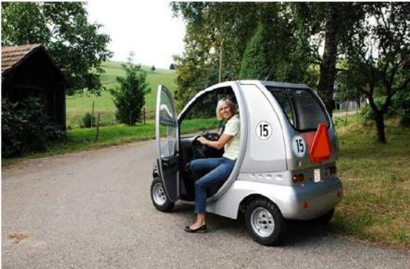
Figuur 2: Een Duits gehandicaptenvoertuig begrensd tot 15 km/uur. Bron: EG autos (2022) 3

In Duitsland zijn gehandicaptenvoertuigen, waaronder ook gesloten gehandicaptenvoertuigen, begrensd tot 15 km/uur. Dit is zichtbaar gemaakt met een sticker zoals te zien is op onderstaande foto. Het voertuig is een éénzitter met een maximale breedte van 1,10 meter.