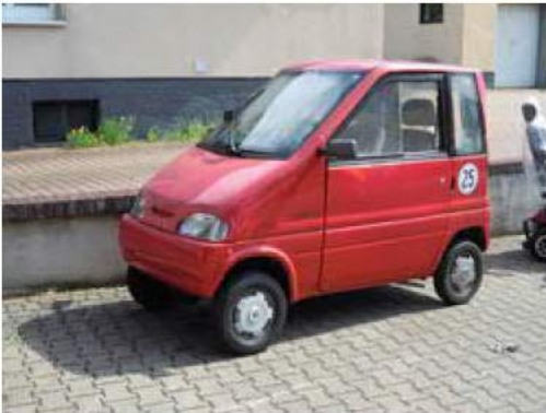
Figuur 4: De zogenoemde '25er', een Duits gehandicaptenvoertuig dat op de weg is gebracht voor 1999. Bron: EG autos (2022) 4

In Oostenrijk bestaat het Führerscheingegesetzes (FSG). Dit is de rijbewijswet waarin bepaald wordt welke personen de weg mogen betreden. Gehandicaptenvoertuigen worden hier net als in het Oostenrijkse StVO niet genoemd. In Oostenrijk geldt wel dat men geen rijbewijs nodig heeft voor elektrische scooters met een ontwerpsnelheid van maximaal 25 km/uur en een maximum vermogen onder de 600 Watt (Oesterreich, 2022). Onder deze elektrische scooters vallen ook enkele elektrische scootmobielen. Ook heeft men in Oostenrijk geen rijbewijs nodig voor voertuigen met een snelheid tot 10 km/uur. Deze voertuigen zijn vrijgesteld van de rijbewijswet (FSG, §1). Wel geldt hiervoor een minimale leeftijd van 16 jaar (FSG, §1.5). Voor voertuigen met een snelheid hoger dan 10 km/uur is wel een rijbewijs en het dragen van een helm verplicht. Gehandicaptenvoertuigen met een gesloten carrosserie zijn niet in de Oostenrijkse wetgeving opgenomen (FSG). Er worden daardoor ook geen speciale eisen genoemd voor gehandicaptenvoertuigen met een gesloten carrosserie (FSG).