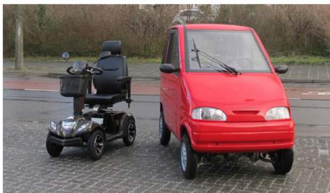
Figuur 1: Links een scootmobiel en rechts een gehandicaptenvoertuig met gesloten carrosserie.

Een voorbeeld van een gesloten gehandicaptenvoertuig is de Canta, rechts in onderstaande afbeelding (SWOV, 2018).