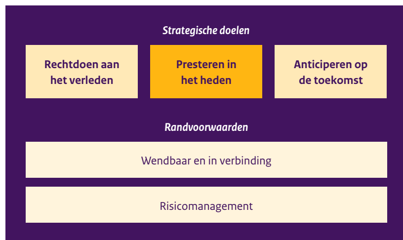
Figuur 1: veranderopgaven Dienst Toeslagen

Bij het rechtdoen aan het verleden zet Toeslagen ten eerste in op financieel herstel bieden aan gedupeerden van de kinderopvangtoeslagaffaire. In 2024 wordt op snellere wijze herstel geboden aan gedupeerde ouders. Daarnaast wordt het bezwaarproces verbeterd met een snellere afhandeling van bezwaren tot gevolg. Het zwaartepunt bij de oplevering van dossiers wordt meer gelegd bij snelheid en eenvoud, en minder bij de uitgebreide controle op elk dossier.