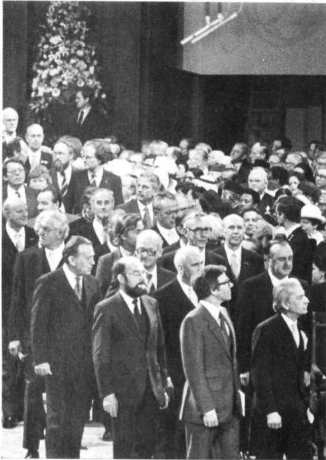
Binnenkomst kamerleden en buitenlandse missies