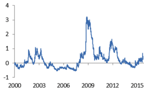
Figuur 1 – Indicator van financiële stress (DNB stress-index) 1

1 Stress-index, gebaseerd op indicatoren van voor Nederland relevante aandelen-, obligatie- en valutamarkten en een index van de gezondheid van financiële instellingen. Bron: DNB, Overzicht Financiële Stabiliteit in Nederland – najaar 2015 (1 januari 2000–18 september 2015) . Bron: DNB