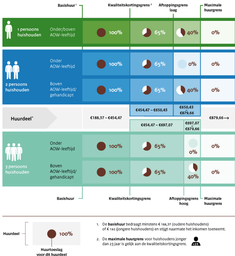
Figuur 1 Visualisatie werking huurtoeslag 2024; meerpersoonshuishoudens onder de AOW-leeftijd ontvangen over het laatste huurdeel geen vergoeding

Naast dat deze maatregelen voor harmonisatie van het aantal huishoudtypes de betaalbaarheid van wonen verbeteren voor niet-ouderenshuishoudens en in het bijzonder meerpersoonshuishoudens met een hogere huur, wordt de regeling ook begrijpelijker. Hiermee zijn er minder situaties waarop het huishoudtype, en daarmee de hoogte van het huurtoeslagbedrag, kan wijzigen.