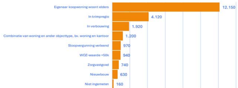
Figuur 3. Mogelijke verklaringen structurele leegstand na energiecorrectie, in aantallen woningen die aan één of meer verklarende kenmerken voldoen

Hiermee geef ik invulling aan de toezegging aan mevrouw Beckerman over een onderzoek naar verklarende kenmerken bij structureel leegstaande woningen voor het einde van 2024, gedaan tijdens het commissiedebat over ruimtelijke ordening van 2 oktober 2024 (TZ202410–049).