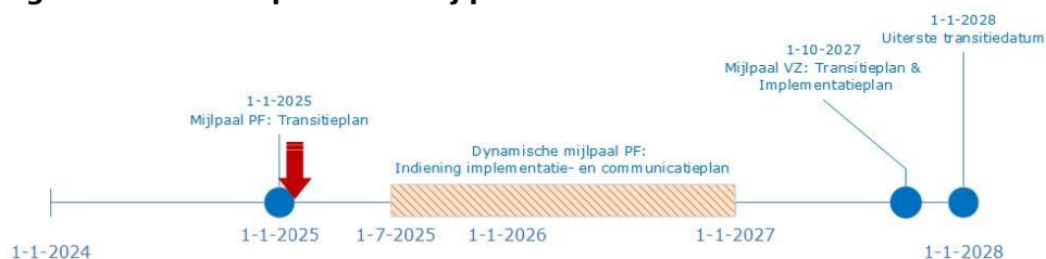
Figuur 1: Transitieperiode - mijlpalen