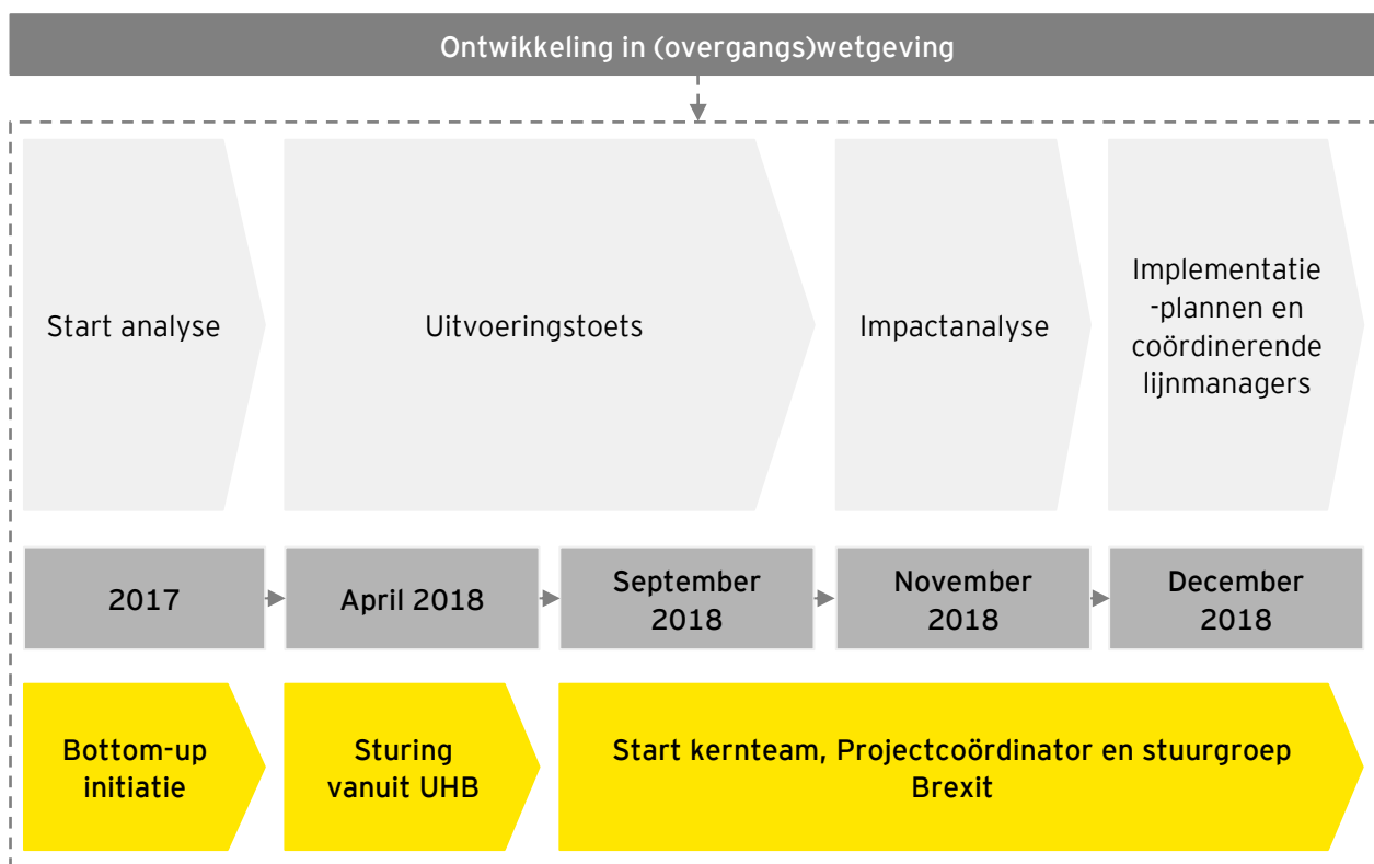
Figuur 3: Verloop voorbereidingsproces

Dit hoofdstuk gaat in op de kwaliteit van het totale voorbereidingsproces van de Belastingdienst op de Brexit zoals beschreven wordt in onderstaande figuur 3, in termen van voortgang en beoogd resultaat. Ten slotte wordt een aantal mogelijke risico's en voor progressie in de verdere voorbereiding opgesomd.