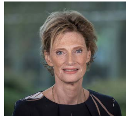
Alida Oppers Inspecteur-generaal van het Onderwijs

Juist onder de omstandigheden waarmee we nu te maken hebben, is de vraag wat de rol van de inspectie is. Die blijft: beoordelen, informeren, agenderen, activeren en soms ook interveniëren en aanjagen. Eraan bijdragen dat alle betrokkenen hun rol en hun verantwoordelijkheid nemen. Denkend vanuit het onderwijsstelsel en interveniërend daar waar dat het meeste nodig is. Dat deden we ook in 2020, met alle beperkingen die er waren. In dit jaarverslag verantwoorden we ons over ons werk in het voorbije jaar. In getallen en in een aantal belangrijke ontwikkelingen.